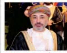
الشيخ عبد الله بن سليمان بن حمد الحارثي رئيس مجلس إدارة الجامعة