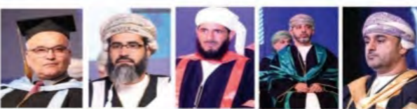
مفتحة من كلمات البروفيسور فؤاد شفيق رئيس الجامعة في حفل التخرج للخريجين

مستوى عال من التحصيل العلمي، وذلك بفضل توجيهاتكم السليمة التي جعلتكم من طلبة متميزين، وقد أتمنى لكم مستقبلًا مشرقًا مليئًا بالفرص والنجاح. إنكم اليوم تخرجون من الجامعة بأكبر عدد من الخريجين، وهذا بفضل توجيهاتكم السليمة التي جعلتكم من طلبة متميزين، وقد أتمنى لكم مستقبلًا مشرقًا مليئًا بالفرص والنجاح. إنكم اليوم تخرجون من الجامعة بأكبر عدد من الخريجين، وهذا بفضل توجيهاتكم السليمة التي جعلتكم من طلبة متميزين، وقد أتمنى لكم مستقبلًا مشرقًا مليئًا بالفرص والنجاح. إنكم اليوم تخرجون من الجامعة بأكبر عدد من الخريجين، وهذا بفضل توجيهاتكم السليمة التي جعلتكم من طلبة متميزين، وقد أتمنى لكم مستقبلًا مشرقًا مليئًا بالفرص والنجاح.