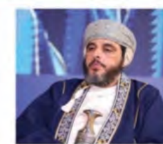
المكرم البروفيسور/ يحيى بن منصور الوهيبي نائب رئيس الجامعة للبحوث والتطوير العلمي