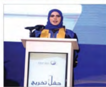
فدما لا يسعني إلا أن أشكر لكم بسان الجمع من خريجي الفصحة التاسعة لجامعة الشرقية، خالص الامتنان والشكر على لشرفكم حفلنا الذي زاد بهجة وألما بحضوركم ومشاركتكم.

أمسكت عن نفسي ذبيبة من زملائي الخريجين والخريجات أفقد أمامكم اليوم لتحتسب بغيري شاعرًا ووطنًا وجهدًا وألتمت لكم بشري نجاحًا وتخرجنا من هذا الصرح العلمي الشامخ، لم تكن الجامعة مرحلة دراسية حسب وإنما كانت تجربة استثنائية بكل محابرها، كان بحضورها أن نحس الشغف بأرواحنا ونصونا بمكان القوة بدلونا، صلقت شخصياتنا بصورة بارعة، واكتسبنا مهارات ما كان يحضور أي تجربة إنسانية أخرى إن تكسنا إياها.