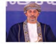
السيد عبد الله بن حمد بن سيف اليعقوبي رئيس مجلس أمناء الجامعة